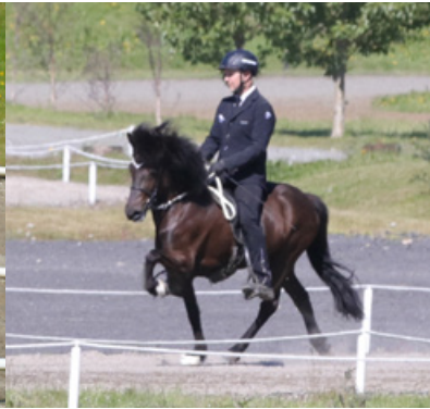
Vallarsól von Vellir