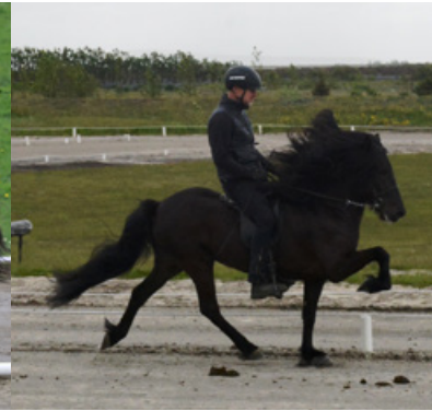
Hjör von Vellir