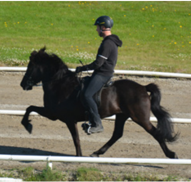
Sónata von Vellir

Fotos: Ida Thorborg und Brigitte Baumgartner. Trainer: Ida Thorborg. Reiter: Jakob Svavar Sigurðsson