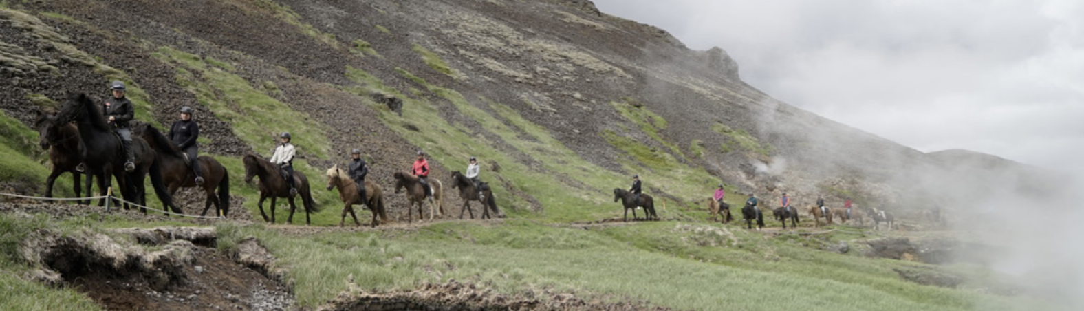
The Valley Reykjadalur – A Hidden Paradise!