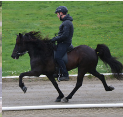
Sinfónía von Vellir